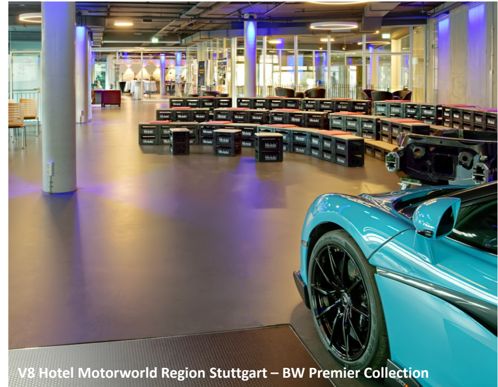
V8 Hotel Motorworld Region Stuttgart – BW Premier Collection