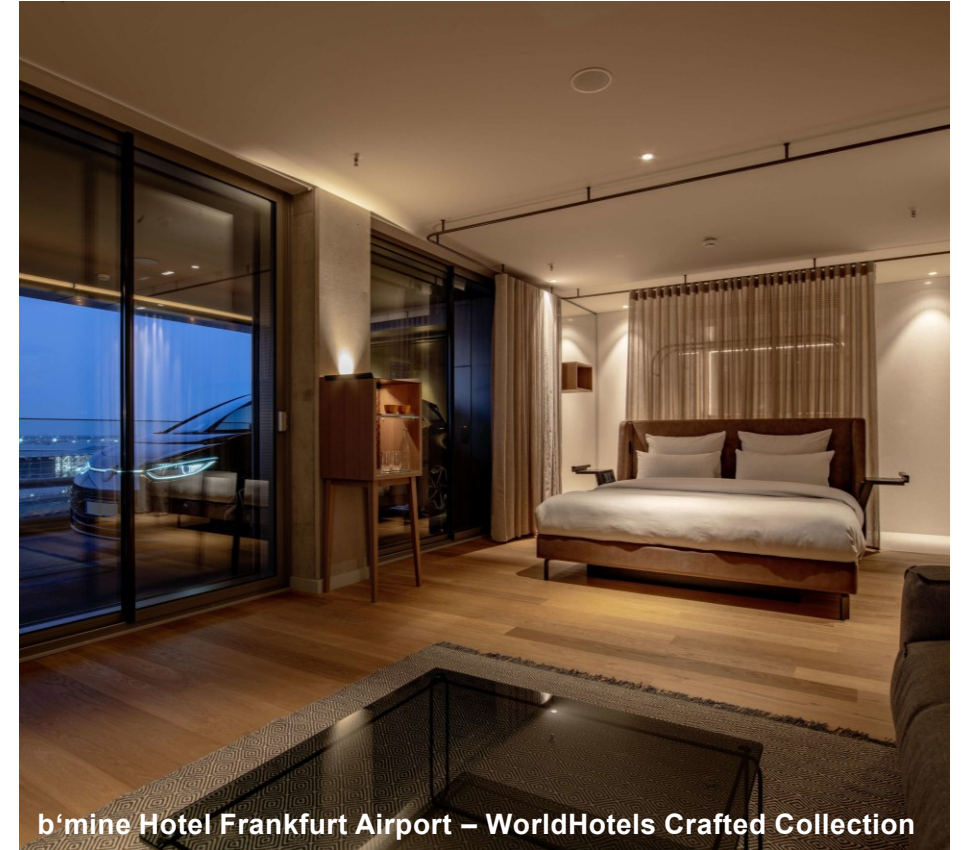
b'mine Hotel Frankfurt Airport – WorldHotels Crafted Collection